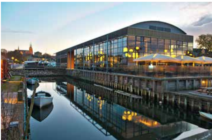
Restaurant Snekken og RoS Gallery

Vi glæder os til at byde dig og dine gæster velkommen